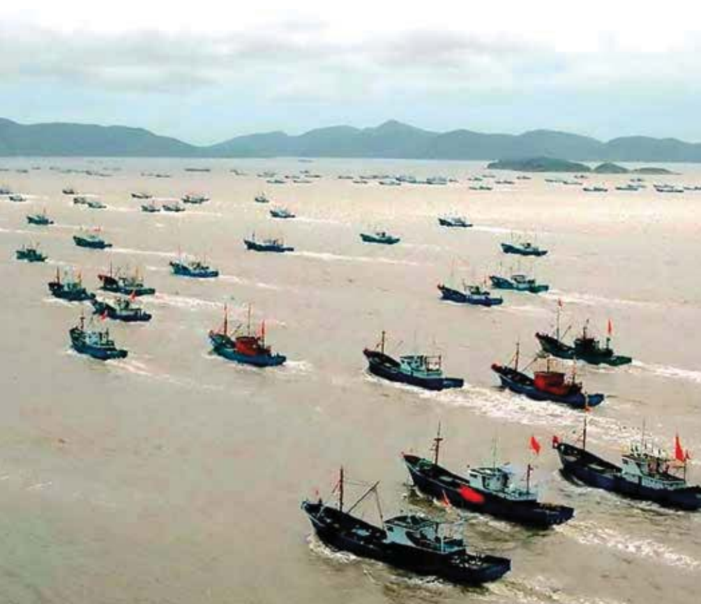
Paramilitärisch organisierte chinesische Fangflotte

RUSI (2017), Video der Presentation von Cathy Haenlein's: „Below the Surface: How Illegal, Unreported and Unregulated Fishing Threatens Our Security“, s.a. Quellcode https://www.youtube.com/watch?v=GufSbEhT7Xc